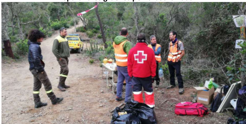
Lloc de control