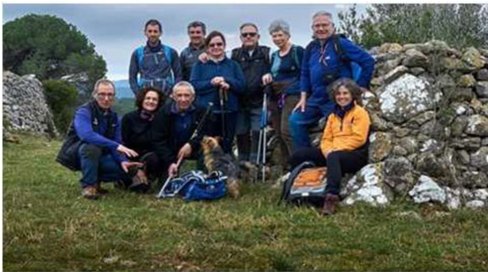
El grup complet a l'eixart de Santa Maria de Palau.