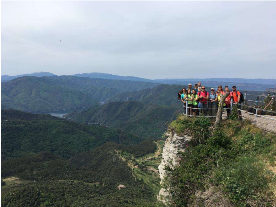
Foto de grup al mirador