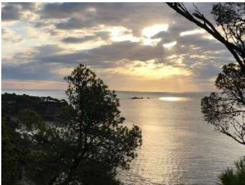
Comença el dia i la mar apareix ben planera, per iniciar la travessa de l'Aquatrail'19