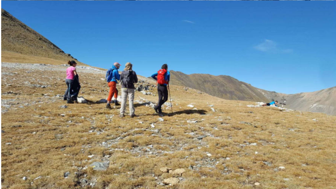
Vistes del Torreneules i preparant foto de grup