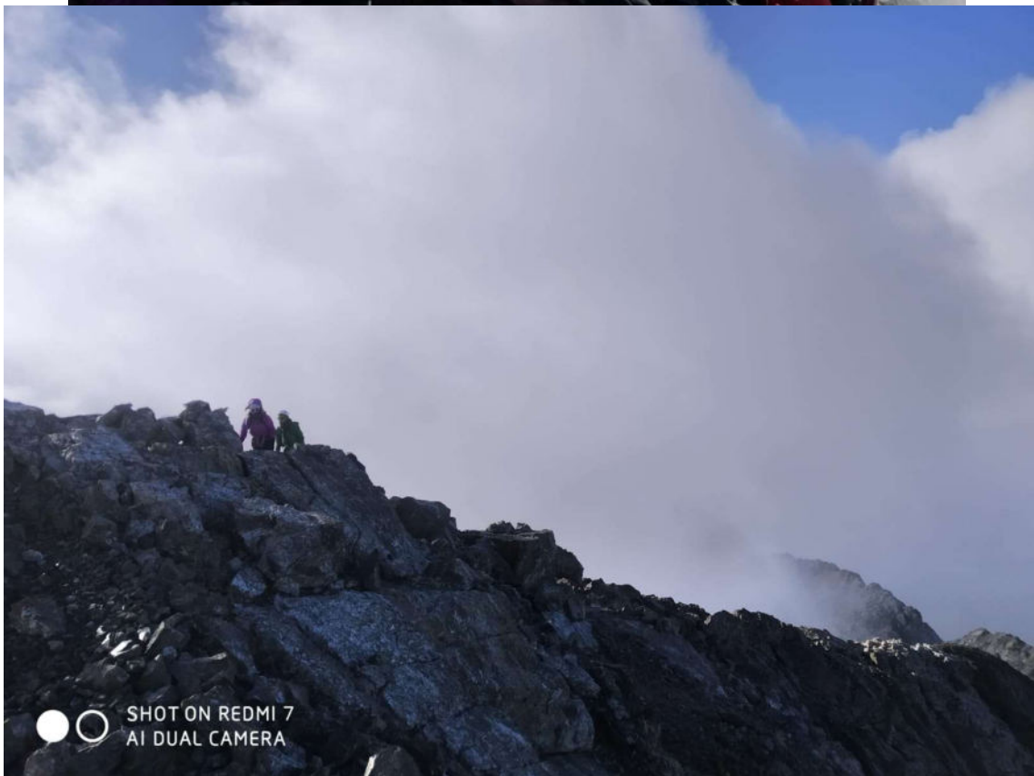
Progressant per la cresta