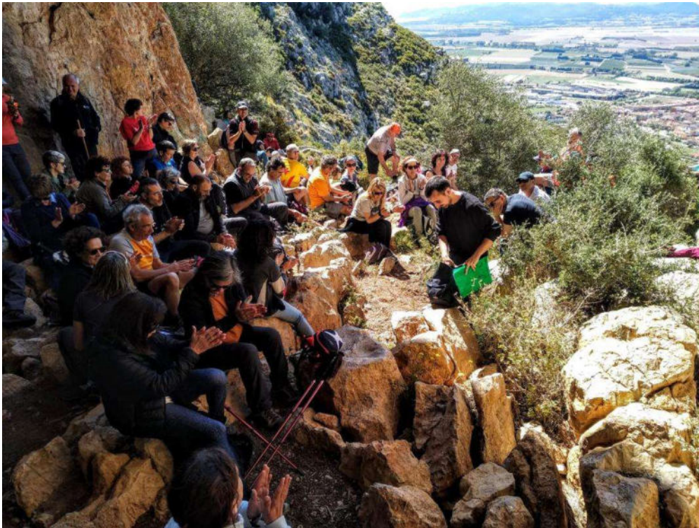
Al recer d'una cova, antic assentament prehistòric, gaudint de les explicacions del companyy arqueòleg