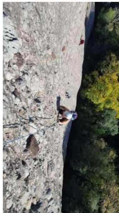
Fent pràctiques d'escalada esportiva, dissabte (esquerra) i via llarga diumenge (dreta)