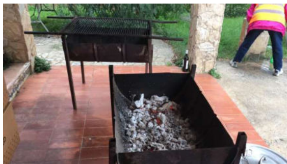
Preparant les graelles per la botifarrada