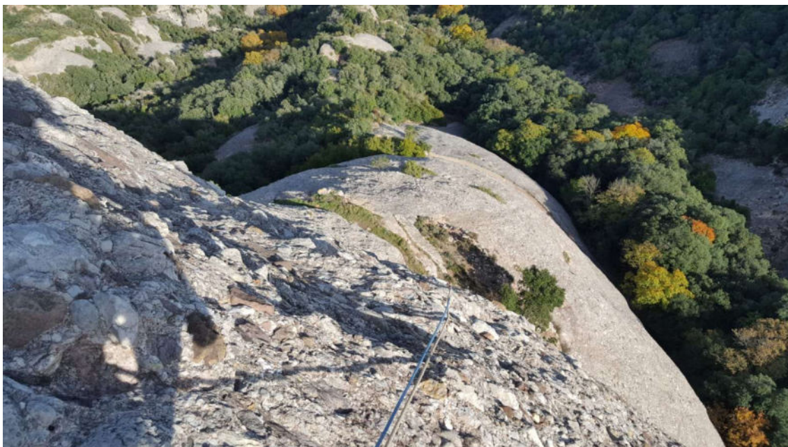
Via llarga, diumenge