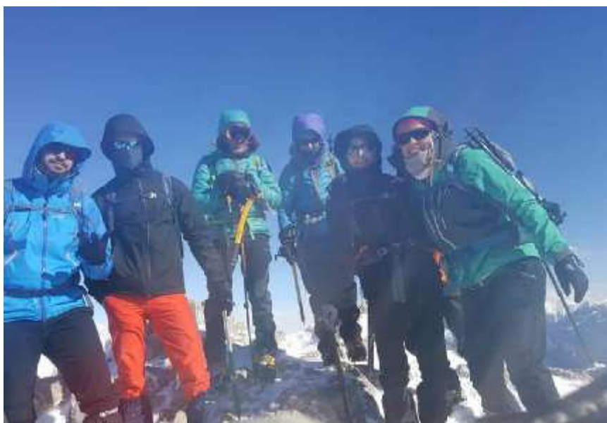
El grup complet al cim del Pedraforca