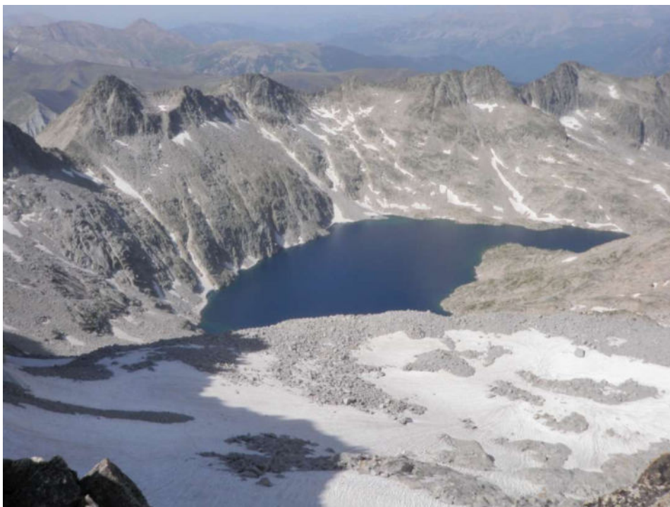
Vistes magnífiques del circ encara farcit de congestes de neu

Es realitza la pernocta al refugi de la Renclusa divendres i dissabte, abans i després de l'activitat, que com es pot veure a les fotografies va gaudir d'èxit tant en la gesta com amb un fantàstic temps estiuenc.