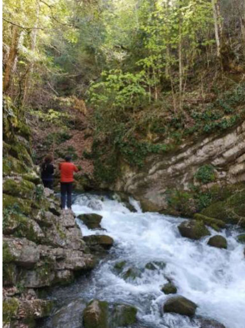
Baixada del torrent ple d'aigua

Fem alguna paradeta per remullar-nos i un cop arribats al pàrquing, ens desplaçem fins una zona propera per contemplar més salts d'aigua i donar per finalitzada una jornada magnífica.