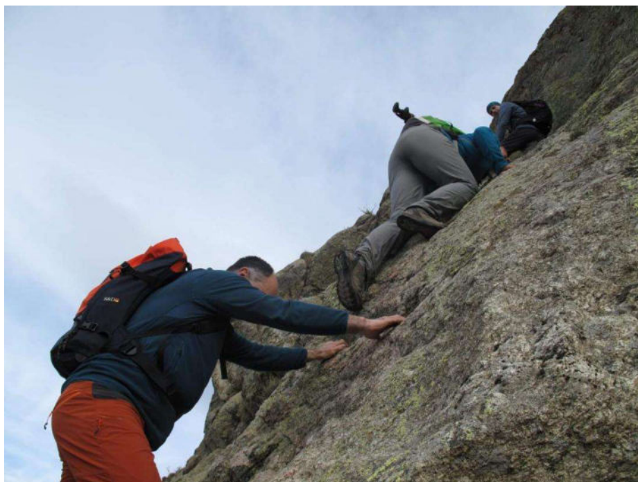
Grimpada per assolir el cim de Sant Salvador