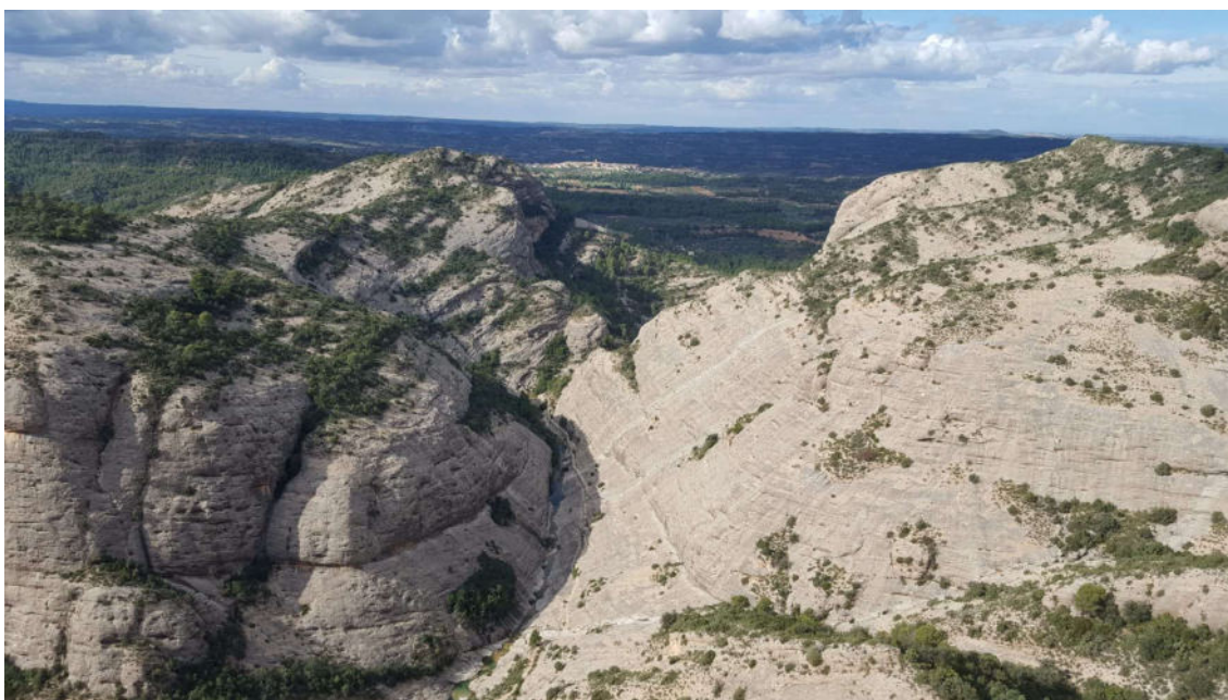
Parets dels Ports del Beseït

Però la incertesa del temps, en entrar una borrasca durant tot el cap de setmana, fa que es canviïn els plans i ens dirigim cap el Sud, els Ports del Beseït on seguim practicant l'escalada en via llarga, aprofitant les diferents tipologies de roca que podem trobar en aquest indret tan bonic.