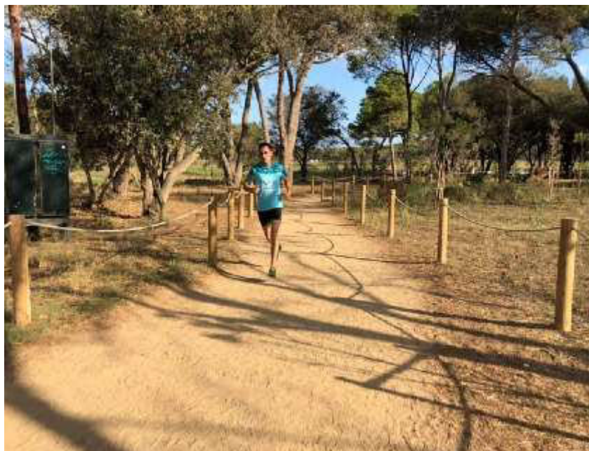
Participant a la carrera

Tornem a unir forces entre els dos clubs de Palamós, el club alpí i el club de natació, per repetir una activitat divertida que es va encetar l'any anterior, al setembre de 2018. Aquesta trobada pretén fomentar la popularització de l'esport, d'una forma divertida i gens competitiva. S'organitza de manera que per parelles es pot assolir tant la cursa al mar com la travessa corrents tant pels dos membres de la parella com per un sol d'ells.