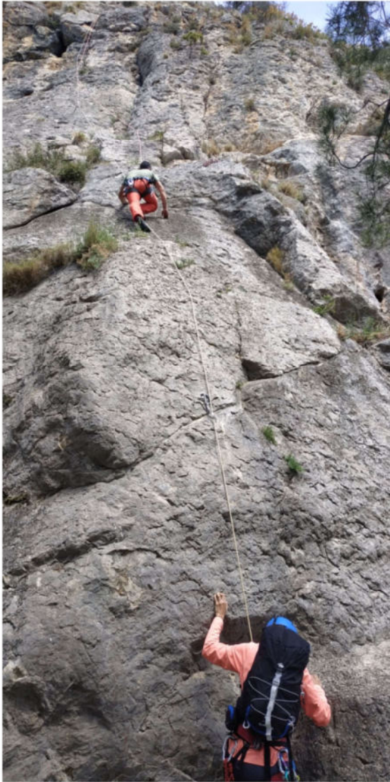
El sector escollit és Rocamaura