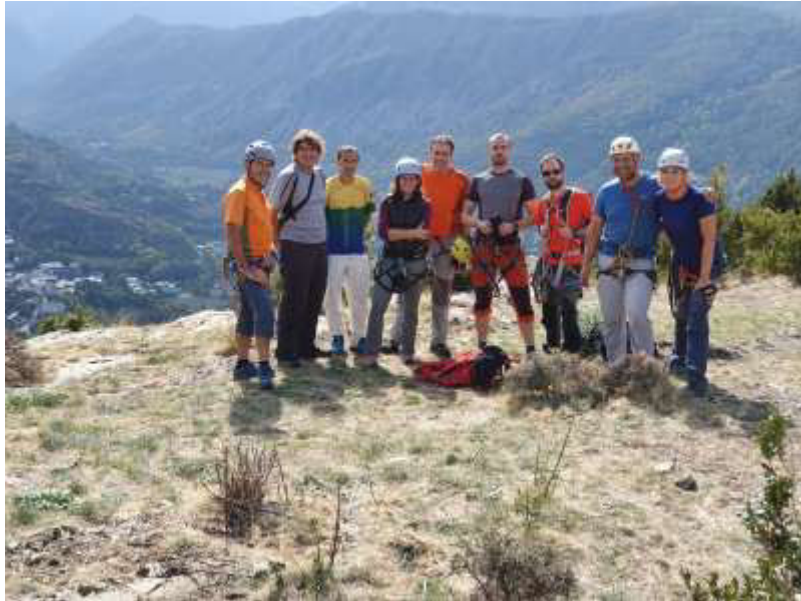
Finalitzada la via ferrada

(3080 m). La resta ens apropem a la base de la cresta on ascendirem la Llardaneta (3332 m), la Tuca de la Llardaneta (3311 m), la Tuqueta Roya (3273 m) i finalment el Posets. El temps és més fred del que s'esperava i el vent i els núvols no ens deixen treva, així que les vistes van i venen durant tota la feixuga però intensament satisfactòria jornada.