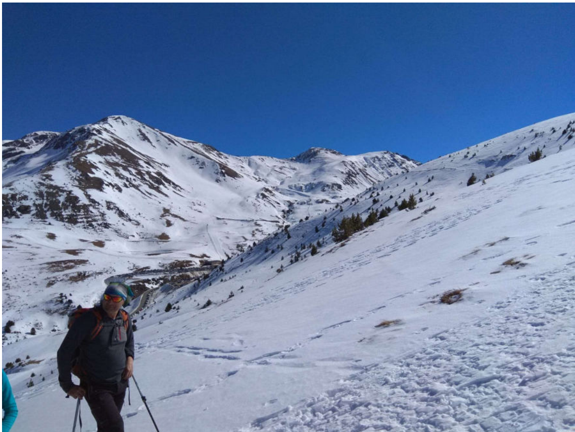
Vistes de la vall de Boí