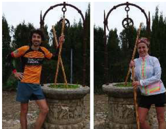
Guanyadors de la cursa amb el bastó de Traginers

Gràcies a tots i totes per la vostra col·laboració en l'organització!!