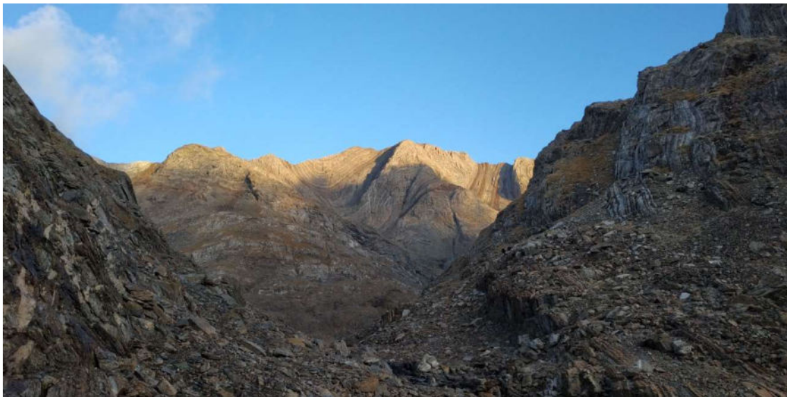
Vistes de la cresta i el Posets, ja de retorn al refugi de Viados