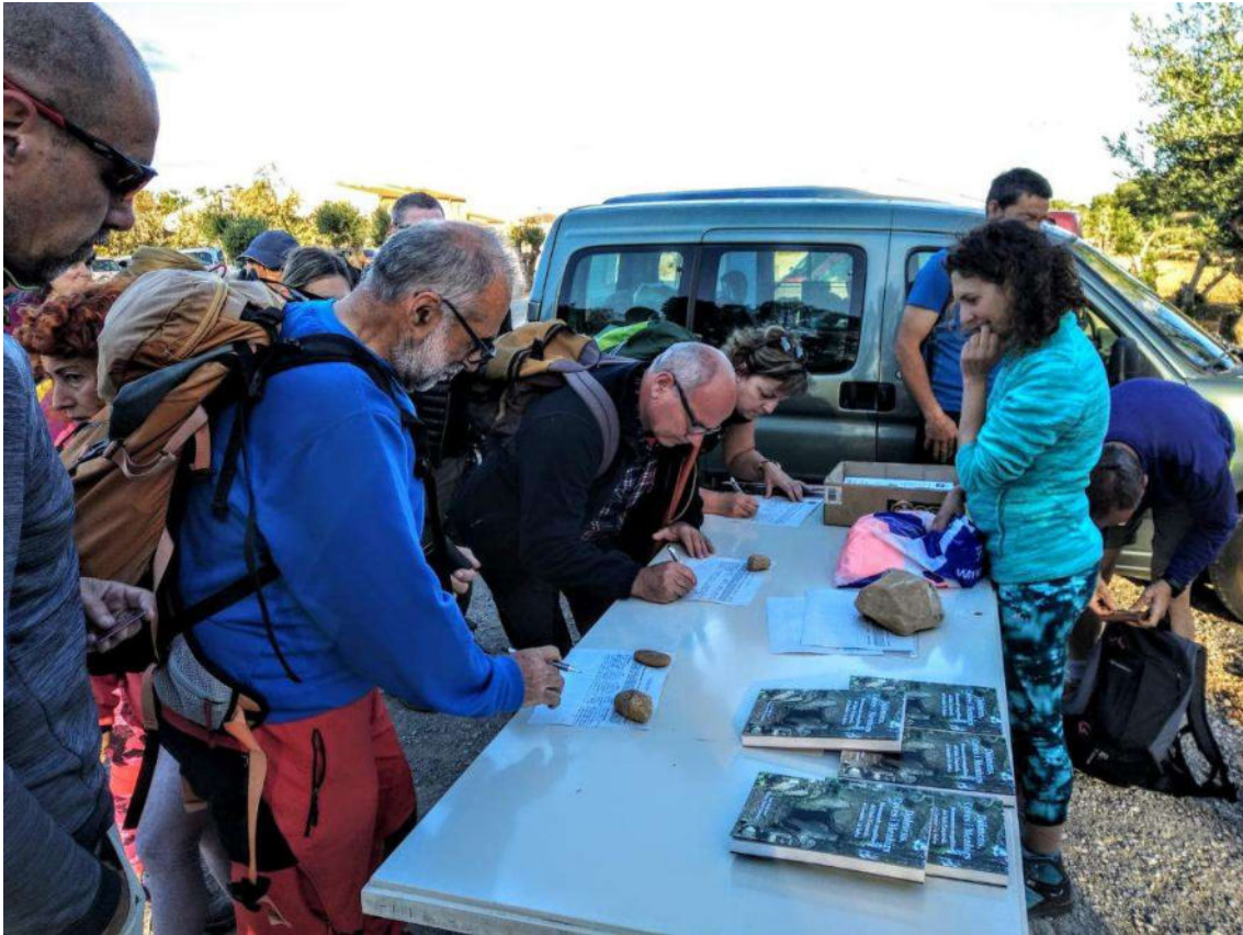
Inscripcions prèvies abans de començar l'itinerari

L'afluència va ser un èxit i es van celebrar els 20 anys d'Itinerari Megalític amb un dinar popular on vam poder manifestar el nostre agraïment a les "alma mater" d'aquesta activitat tan valorada entre els companys del club i d'excursionistes de tota la província.