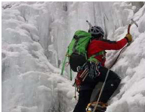
Pràctiques d'escalada amb gel al Pedraforca

El diumenge, ben d'hora i encarant la fred hivernal, s'emprèn la ruta cap el cim del Pedraforca. No hi falta neu i les darreres grimpades ens deixen sense alè, així com la majestuositat del paisatge.