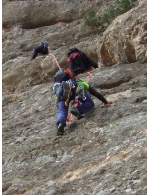
Via llarga. Cordada de 3 components.