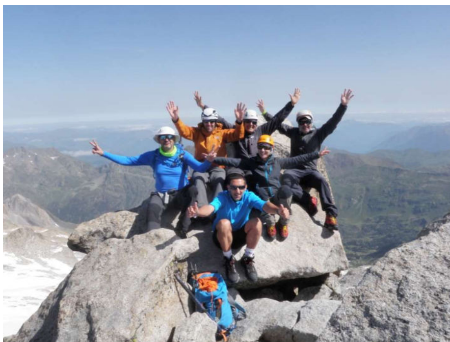
Foto de grup, assolit el cim principal